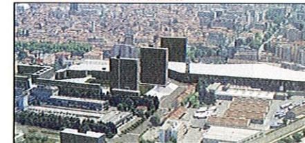
IL PLASTICO DI COMPARTO MILANO

il 2002 si prevede un aumento dei prezzi degli appartamenti tra il 3% e il 6%.