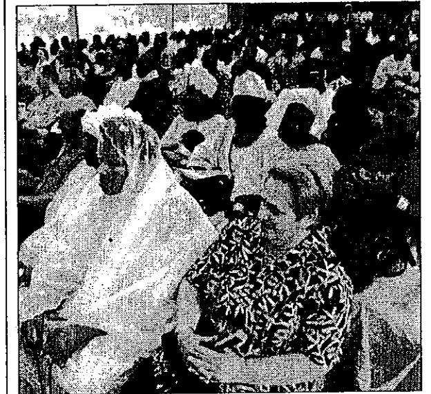
Un'immagine della Festa senegalese dello scorso anno

Festa raddoppiata per il murid islamico Sono attesi migliaia di fedeli senegalesi